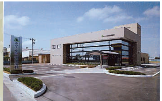
みやぎ東部循環器科

二年目に入ります今年も、諸先生方より更なるご支援を賜りますよう、お願い申し上げます。