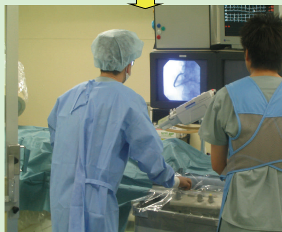
3. 冠動脈造影検査。急性心筋梗塞の場合、引き続き治療。