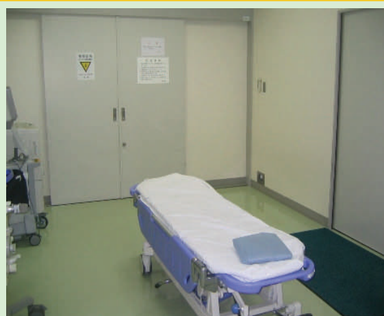
2. 前室。患者様を受け入れ、直ちに冠動脈造影検査が必要か判断。