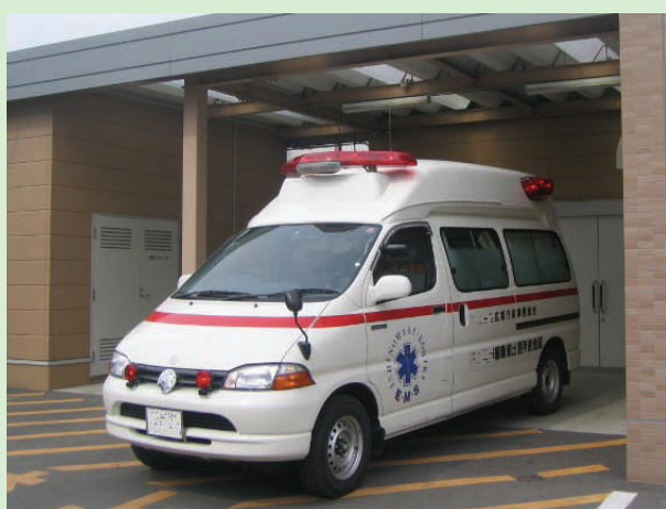
1. 救急受入口。救急車到着。

当院は心臓疾患に対して24時間救急対応体制をとっている全国的にも珍しい循環器科専門の有床診療所です。当院の特色の一つとして、当院の急性心筋梗塞患者様の受け入れから梗塞責任病変部の再開通に要した時間の早さを挙げるすることができます。以下に当院の救急受け入れから治療に至る流れをご説明いたします。